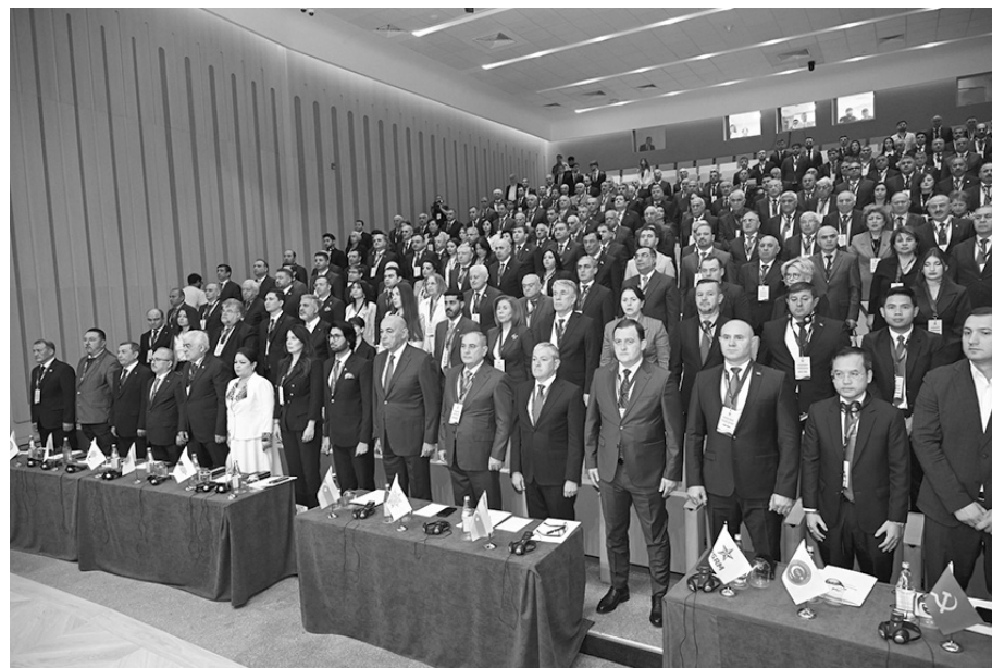
Yeni Azərbaycan Partiyasının Sədri İlham İyün tarixi həmdə “Azərbaycan Respublikasının Prezidenti, Yeni Azərbaycan Partiyasının Sədri

iyun tarixi həmdə “Azərbaycan Respublikası ilə Türkiyə Respublikası arasında mütəfəqqilik münasibətləri haqqında Şuşa Bəyannaməsi”nin imzalanması ilə əlamətdardır: “5 il əvvəl - 2021-ci il iyunun 15-də imzalanmış Şuşa Bəyannaməsi bölgədə sülhün, sabitliyin, təhlükəsizliyin və əməkdaşlığın təşviqinə xidmət edən və gələcəyə konseptual-strateji baxışı ortaya qoyan bir sənəddir. Bəyannamənin imzalanması ilə